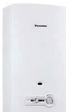
WR – piezo

Pri WRD modelih lahko na vgrajenem LCD zaslonu takoj vidite vse potrebne podatke – od uporabniškega menija do temperature iztočne vode. Če povzamemo – pretočni grelniki vode Junkers MiniMaxx vam ponujajo vrhunsko tehnologijo v kompaktni izvedbi. Vsekakor pa je seveda samoumevno, da pretočni grelniki Junkers ustrezajo vsem varnostnim predpisom.