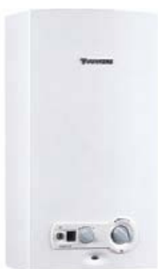
WRD – hydro power