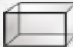
FLAT + Z L D RAVNO + ZADAJ + LEVA IN DESNA STRAN S STEKLOM

FL - FLAT PA - PANORAMA PR - PRISMATIC DV - DVIŽNI RL - RAVNO in LEVO RD - RAVNO in DESNO RZ - RAVNO in ZADAJ RLD - RAVNO, LEVO in DESNO RZL - RAVNO, ZADAJ in LEVO RZD - RAVNO, ZADAJ in DESNO RZLD - RAVNO, ZADAJ, LEVO in DESNO CK - CENTRALNA KURJAVA V - VERTIKALNI