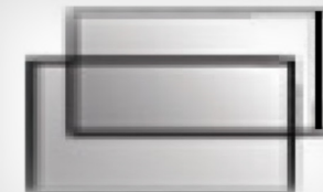
FLAT + Z RAVNO IN ZADAJ STEKLO