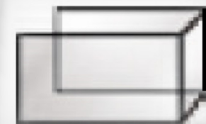
FLAT + D Z RAVNO + DESNA IN ZADNJA STRAN S STEKLOM