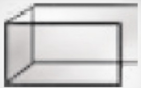
FLAT + L Z RAVNO + LEVA IN ZADNJA STRAN S STEKLOM