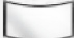
PANORAMA POLKROŽNO STEKLO