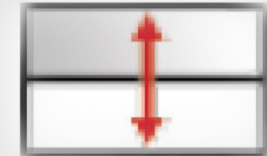
FLAT RAVNO STEKLO Z DVIŽNIM MEHANIZMOM