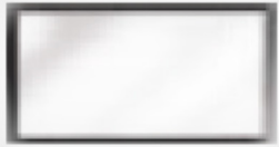
FLAT RAVNO STEKLO