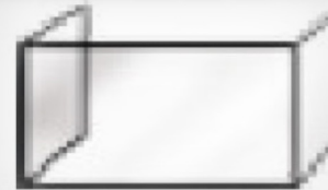
FLAT + L D RAVNO + LEVA IN DESNA STRAN S STEKLOM